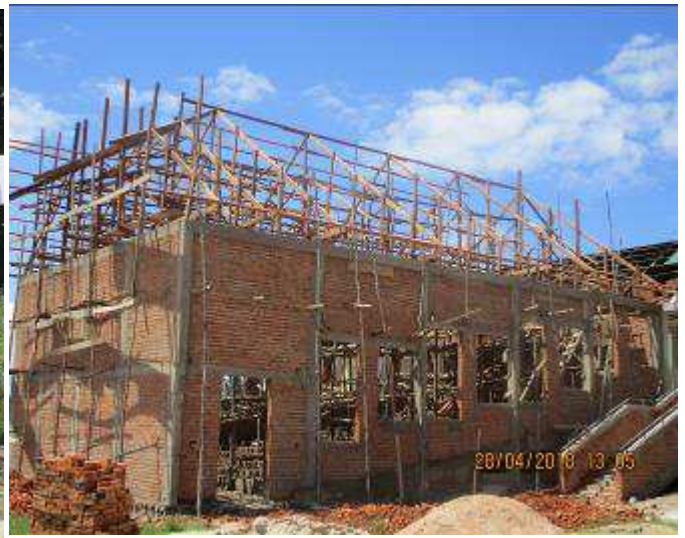
Fig2. Amphithéâtre de 150 places