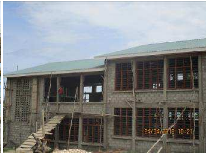
Fig4. Continuité des travaux de menuiserie, pose et fixation des fenêtres au niveau du bâtiment de six auditoires.