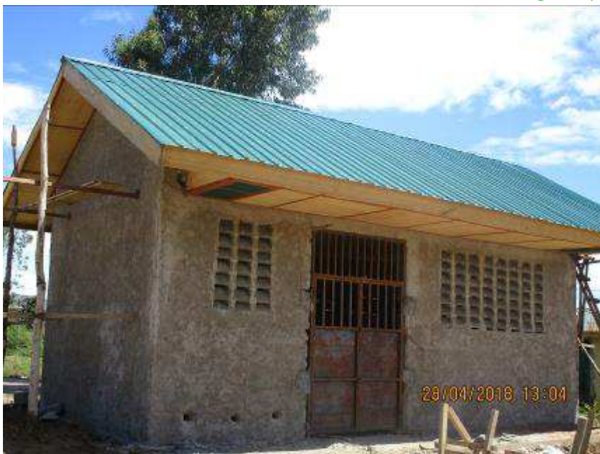
Fig3. La cabine électrique