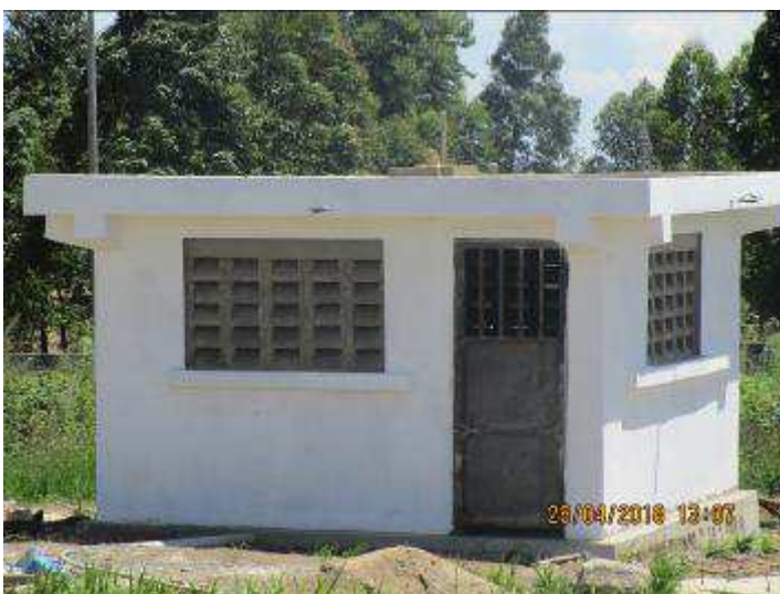
Fig1. Adduction d’eau