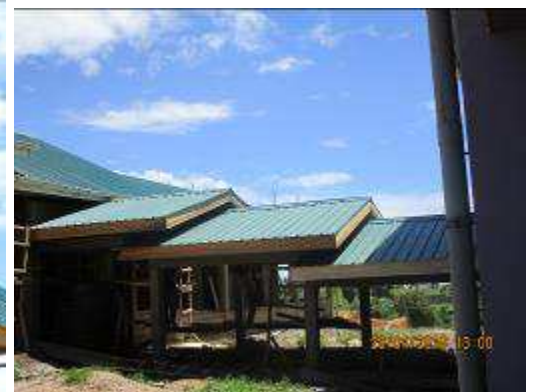
Fig4. Allées couvertes